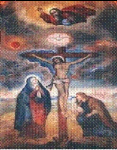
Imagen original del Señor de los Milagros, la cual se encuentra en el Altar Mayor de la